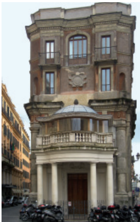
4. Palazzeto Zucari, Roma.

Schinkel did many drawings in his first stay in Rome, the majority urban views and landscapes, in which he tended to adopt high points of view (Szambien1989). In all of them he showed a scenographic perception of the space, which he said to have from his adolescence (Forster 1994, p.18); his drawings were not a representation of