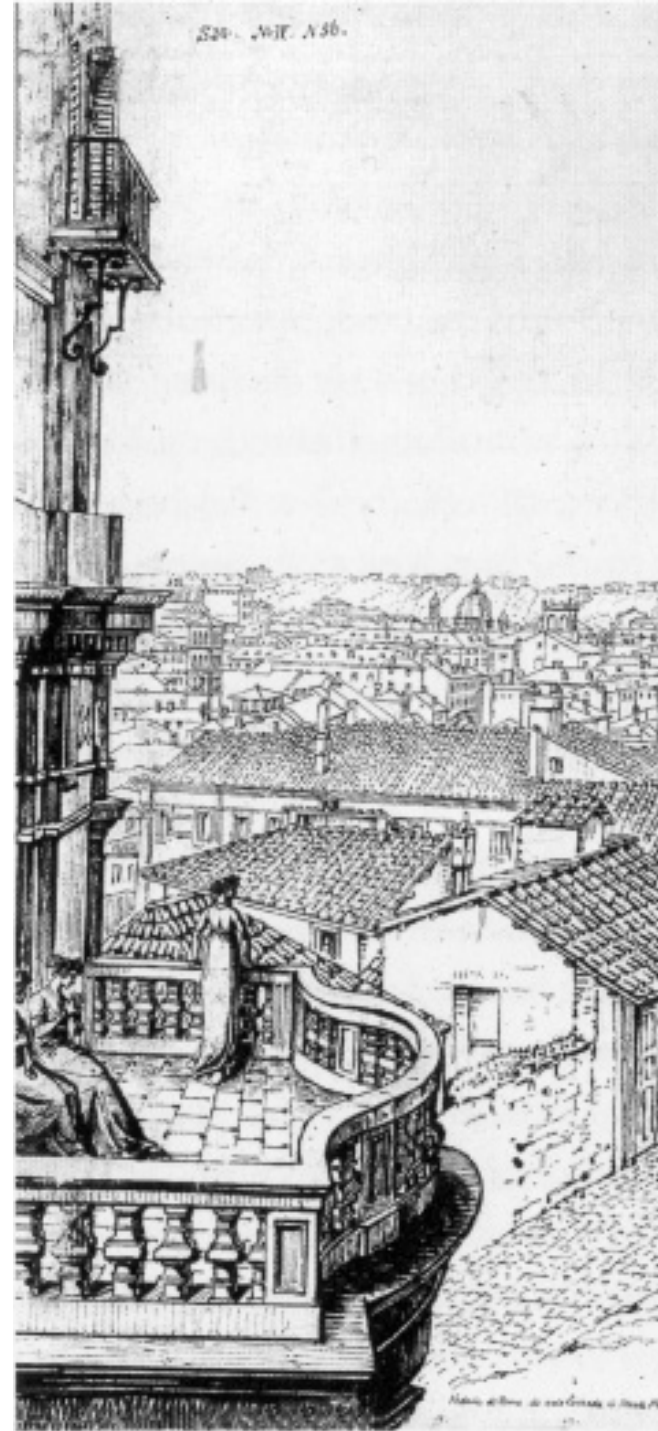
1. K.F. Schinkel, Veduta di Roma da mia Locanda in Monte Pinso presso la Chiesa di St. Trinità del Monte , c.1803-1804.

Keywords: Karl Friedrich Schinkel, Gaspare Vanvitelli, Lieven Cruyl