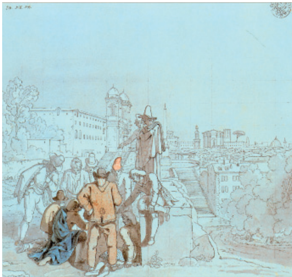
7. G. Vanvitelli, Vista panorámica de Roma con Trinità dei Monti , 1691.