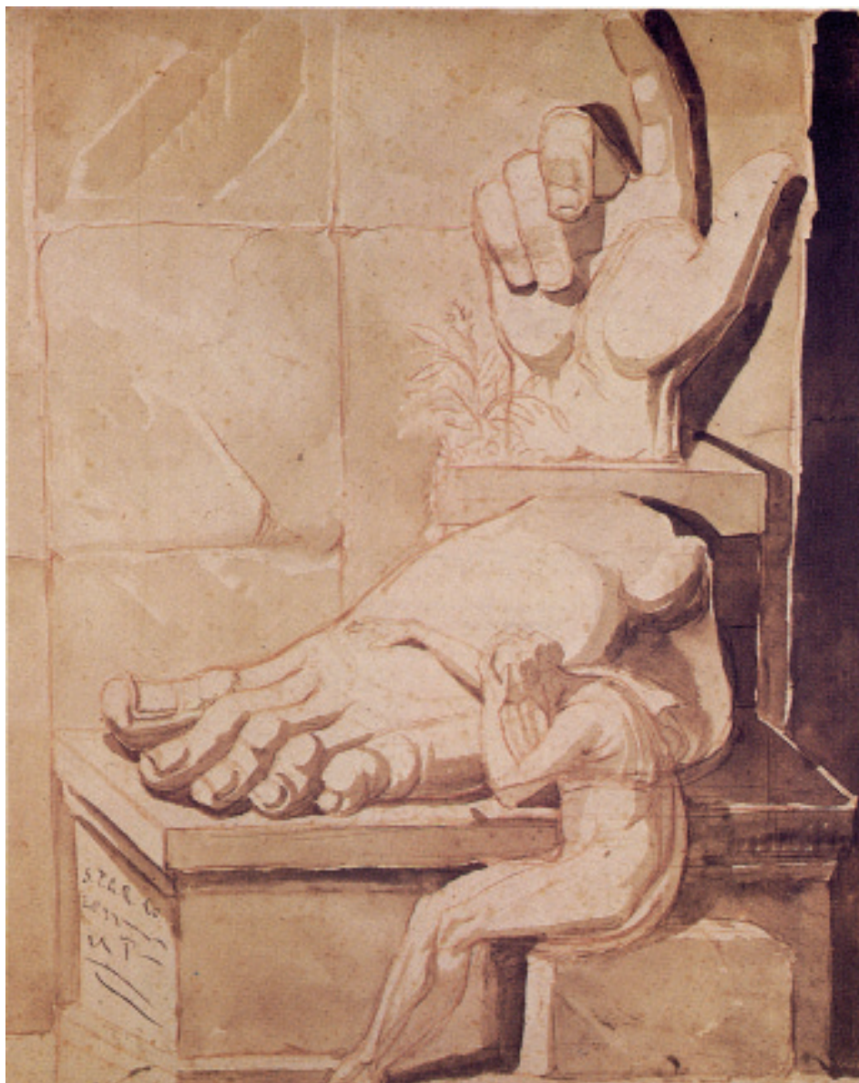
3. H. Fuseli, The Artist's Despair before the Greatness of the Antique Ruins , c.1778-1780.