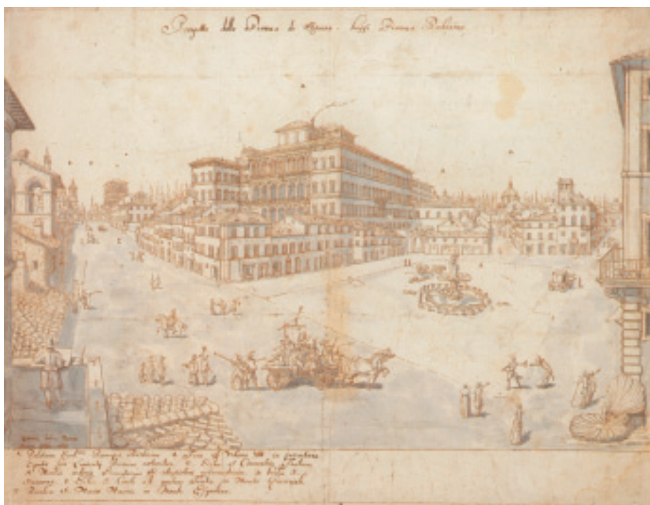
9. L. Cruyl, Prospetto dell Chiesa de S. Ignatio , c.1664-1666 10. L. Cruyl, Prospetto della Piazza di Sforza, hoggi Piazza Barberino , c.1664-1666

puedo contemplarla con ojos tan grandes como los suyos. ¡Si por lo menos hubiera un medio de grabarme sus imágenes en mi alma! Pero me llevo conmigo cuantos grabados y dibujos he podido conseguir de sus obras'. Antes de la difusión de la fotografía, éste era el