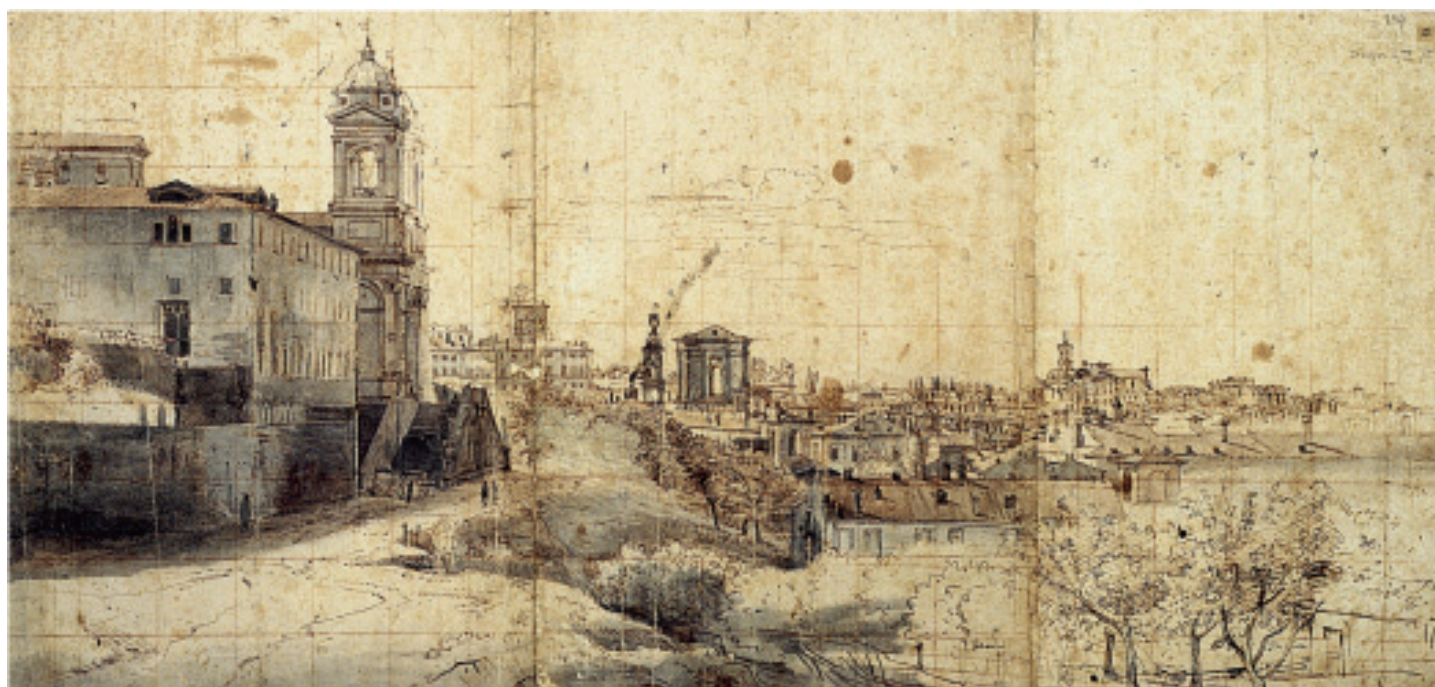
7. G. Vanvitelli, Panoramic view of Rome with Trinità dei Monti , 1681.

more to the right, the campanile and the dome of Sant'Andrea delle Fratte.